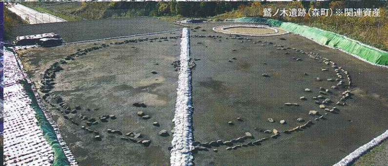
鷺ノ木遺跡 (森町) ※関連資産