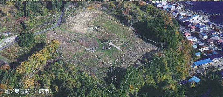
垣ノ島遺跡 (函館市)