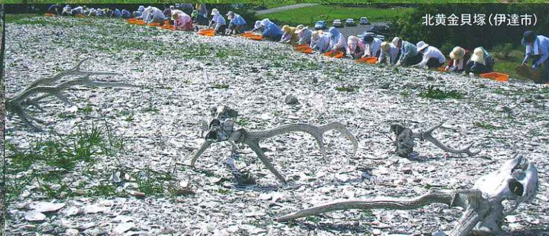
北黄金貝塚 (伊達市)