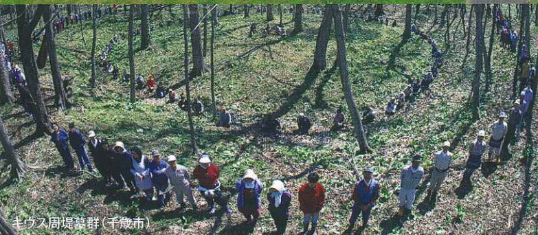
キウス周堤墓群 (千歳市)