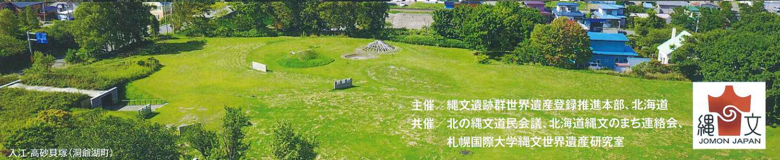
入江・高砂貝塚 (洞爺湖町)

主催 / 縄文遺跡群世界遺産登録推進本部、北海道 共催 / 北の縄文道民会議、北海道縄文のまち連絡会、 札幌国際大学縄文世界遺産研究室